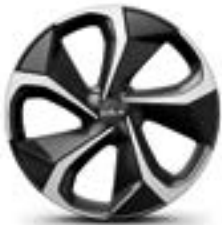
Lichtmetalen velg 20" Sinan