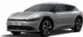
Steel Grey (KLG)