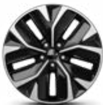
19" lichtmetalen velg (GT-Line)