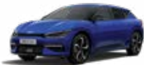
Yacht Blue (DU3)