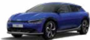
Yacht Blue (DU3)