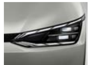
Matrix IFLS LED-koplampen (GT-Line)