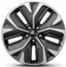
19" lichtmetalen velg