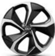
20" lichtmetalen velg