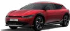
Runway Red (CR5)