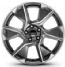
Lichtmetalen velg 19" NonSan (bi-color)