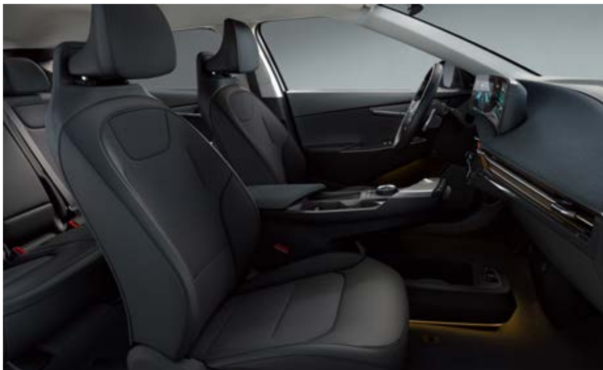
Air: Stof / vegan leder combinatie