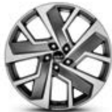
Lichtmetalen velg 20" GunSan (bi-color)