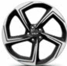
Lichtmetalen velg 21" Haenam