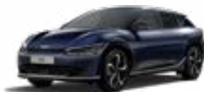
Gravity Blue (B4U)