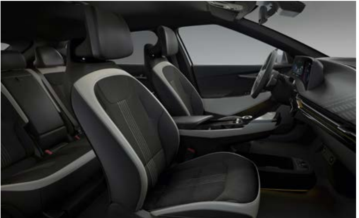
GT-Line: Zwart suède met vegan lederen wangen.

Van zacht, duurzaam suède tot hoogwaardig vegan leer en circulaire materialen: de Kia EV6 is ergonomisch ontworpen voor optimaal comfort en ontspanning - fysiek en mentaal. Milieuvriendelijk en duurzaam. Het gaat niet alleen om stijl, het gaat om een nieuwe bewustwording en een nieuwe manier van leven.