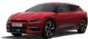
Runway Red (CR5)