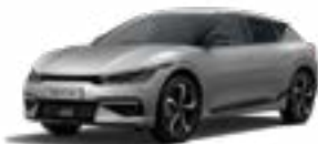
Moonscape matte* (KLM)