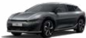
Interstellar Grey (AGT)