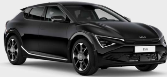
Aurora Black Pearl Kleurcode: ABP