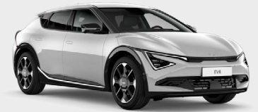
Wolf Grey Kleurcode: C7S