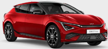
Runway Red Kleurcode: CR5