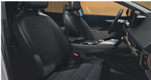
Stof/vegan leder combinatie

Stoelzitting in donkergrijs met subtiel reliëf, het bovenste gedeelte van de rugleuning en hoofdsteun afgewerkt in het zwart. Dashboard met duurzame materialen en in donkergrijze tinten.