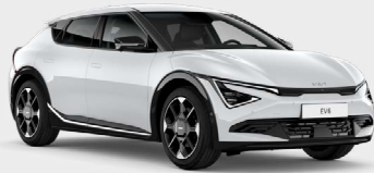
Snow White Pearl Kleurcode: SWP