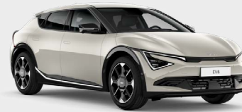
Glacier Kleurcode: GLB