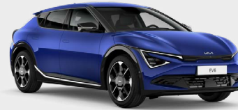
Yacht Blue Kleurcode: DU3