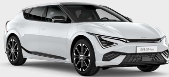
Snow White Pearl Kleurcode: SWP