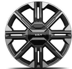
20" lichtmetalen velgen (255/45 R20) Standaard voor GT-Line