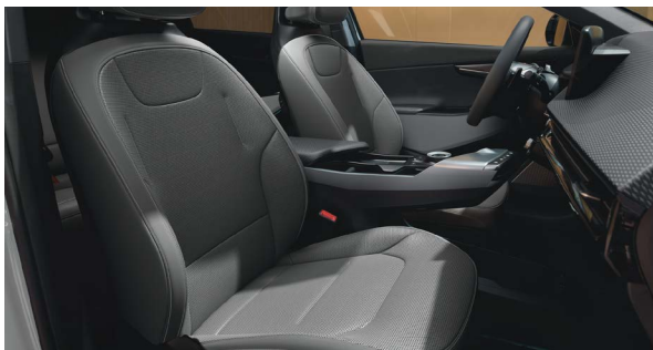
Vegan lederen bekleding - lichtgrijs met donkergrijs

Stoelzitting in lichtgrijs met subtiel reliëf, het bovenste gedeelte van de rugleuning en hoofdsteun afgewerkt in donkergrijs. Dashboard met duurzame materialen en in lichtgrijze tinten.