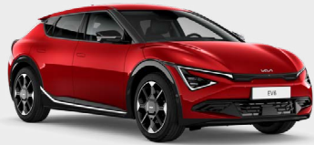
Runway Red Kleurcode: CR5

Beschikbaar op Light Edition / Air / Plus / Plus Advanced.