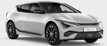
Wolf Grey Kleurcode: C7S