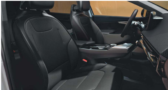
Vegan lederen bekleding - zwart

Stoelzitting in zwart met gewatteerde horizontale afwerking, het bovenste gedeelte van de rugleuning en hoofdsteun afgewerkt in het zwart. Dashboard met duurzame materialen en in donkergrijze tinten.