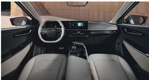
GT-Line design in suède/vegan leder combinatie - GT-Line