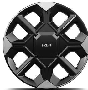
20" lichtmetalen velgen (255/45 R20) Standaard voor Plus 84kWh en Plus Advanced