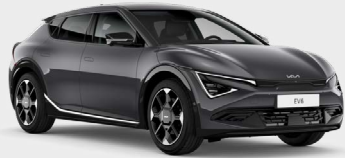
Interstellar Grey Kleurcode: AGT