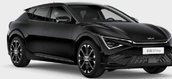
Aurora Black Pearl Kleurcode: ABP