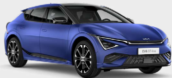
Yacht Blue Matte Kleurcode: DUM