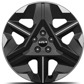
19" lichtmetalen velgen (235/55 R19) Standaard voor Light Edition, Air en Plus 63kWh