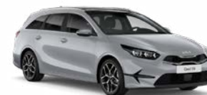
Wolf Grey Kleurcode: WAF