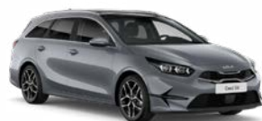
Lunar Silver Kleurcode: CSS (niet mogelijk i.c.m Design Edition)