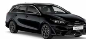
Black Pearl Kleurcode: 1K