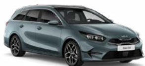
Yucca Steel Grey Kleurcode: USG