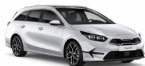
Deluxe White Kleurcode: HW2 (niet mogelijk i.c.m Design Edition)