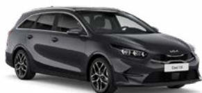
Penta Metal Kleurcode: H8G