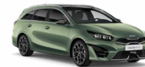
Experience Green Kleurcode: EXG