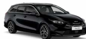
Black Pearl Kleurcode: 1K