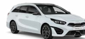
Cassa White Kleurcode: WD