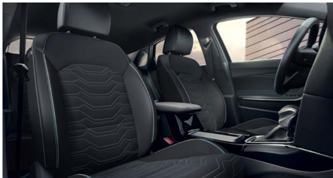
Stof-/lederlook combinatie - Zwart met Yucca Steel Grey