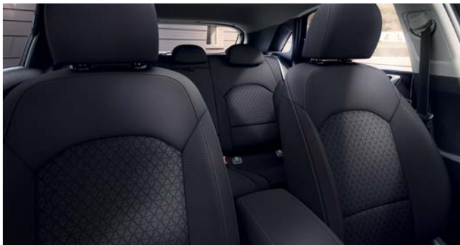
Stoffen bekleding - zwart

Stoelbekleding stof met triangelpatroon verwerkt in de rugleuning.