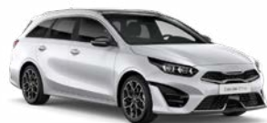
Deluxe White Kleurcode: HW2