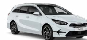
Cassa White Kleurcode: WD