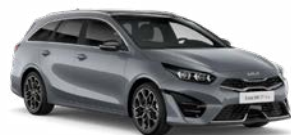
Lunar Silver Kleurcode: CSS