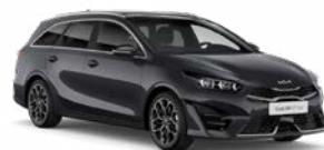
Penta Metal Kleurcode: H8G