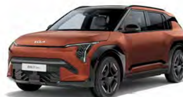
Terra Cotta Kleurcode: TCT