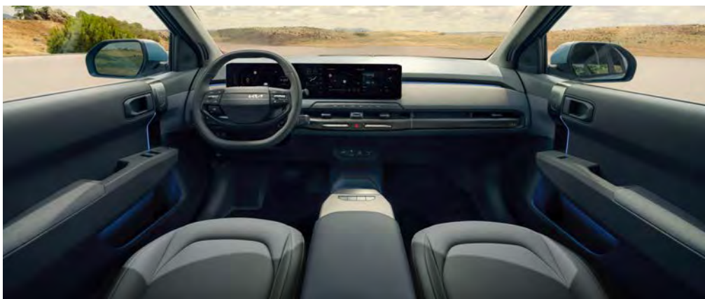
Vegan lederen bekleding - two-tone grijs

Vegan lederen stoelbekleding in een combinatie van lichtgrijs en donkergrijs. De middenconsole en de stoelbekleding beschikken over lichtblauwe accenten. Het dashboard, de deurpanelen en -armsteunen zijn voorzien van stoffen bekleding.