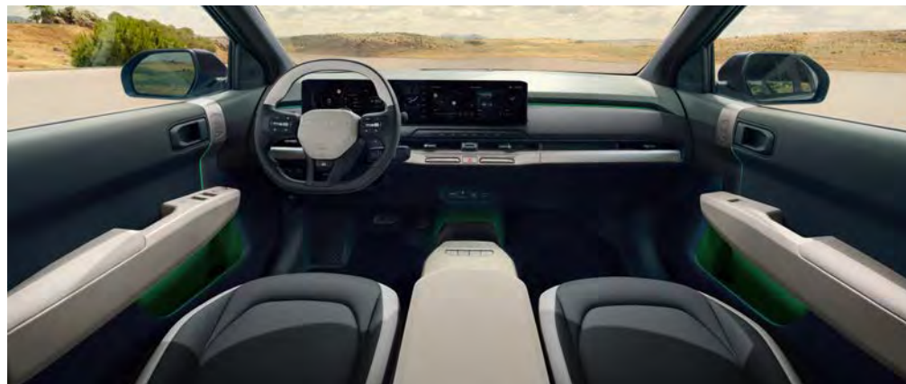
Vegan lederen bekleding - two-tone gebroken wit/grijs

Vegan lederen GT-Line stoelbekleding in een combinatie van gebroken wit en donkergrijs. Armsteunen in de deuren zijn voorzien van vegan leder en het dashboard en de deurpanelen zijn voorzien van stoffen bekleding. De hoofdsteunen zijn voorzien van mesh stof en de achterkant van de voorstoelen is aan de bovenzijde voorzien van een stoffen afwerking.