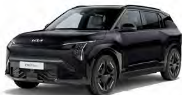
Aurora Black Pearl Kleurcode: ABP