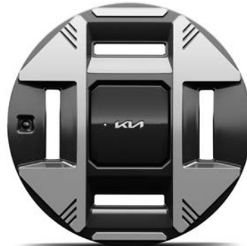
19" lichtmetalen velgen (215/50 R19) Standaard voor Plus Advanced uitvoeringen