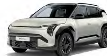
Ivory Silver Glossy Kleurcode: ISG