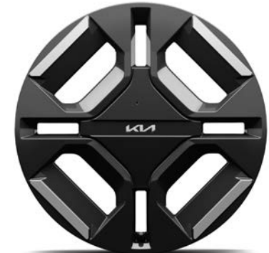
19" lichtmetalen velgen (215/50 R19) Standaard voor GT-Line uitvoeringen