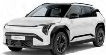
Clear White (solid) Kleurcode: UD

Kleuren beschikbaar voor alle uitvoeringen