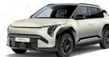
Ivory Silver Mat Kleurcode: ISM