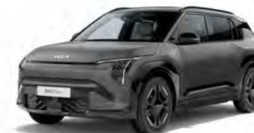
Shale Grey Kleurcode: EBD