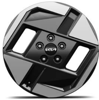
17" lichtmetalen velgen (215/60 R17) Standaard voor Air en Plus uitvoeringen