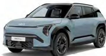
Frost Blue (solid) Kleurcode: EBB