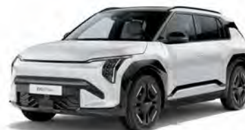
Snow White Pearl Kleurcode: SWP