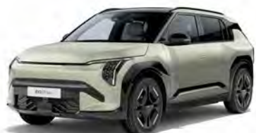
Aventurine Green Kleurcode: AG3