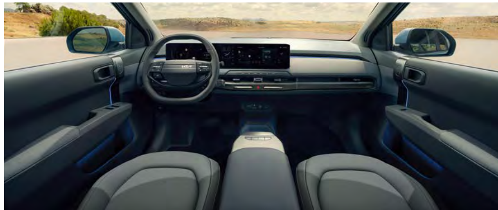
Stoffen bekleding - two-tone grijs

Stoffen stoelbekleding in een combinatie van lichtgrijs en donkergrijs. De middenconsole en de stoelbekleding beschikken over lichtblauwe accenten. Het dashboard, de deurpanelen en -armsteunen zijn voorzien van stoffen bekleding.