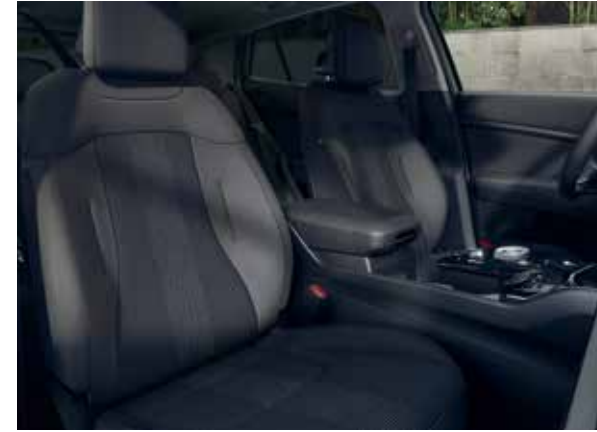
Sportage DynamicLine: zwart stof "luxe".

De Sportage DynamicLine-uitvoering heeft een luxe zwarte stoffen stoelbekleding met zwarte stiksels en hemelbekleding in stijlvol grijs.