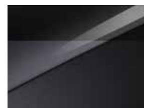
Pearl black & Penta metal (HA6)