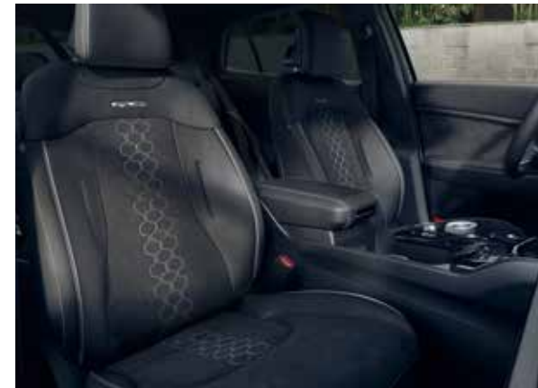
GT-Line suède/kunstleder, zwart. Zwarte suède zitting met gewatteerde middenbaan. De combinatie van kunstleder is afgewerkt met stijlvolle contrasterende witte stiksels en witte biezen en een gepreegd GT-Line logo. Portierbekleding in soft-touch, suède binnenpanelen, suède/kunstlederen bekleding op de armleuningen en chique zwarte hemelbekleding maken dit interieur compleet.

De stoelen met zwarte stof en kunstlederen bekleding zijn voorzien van stijlvolle zwarte stiksels. Geleverd met soft-touch portierbekleding, kunstlederen armleuningen, kunstlederen portierpanelen en hemelbekleding in stijlvol grijs.