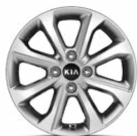
15" lichtmetalen velg M