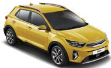
Honey Bee _ B2Y