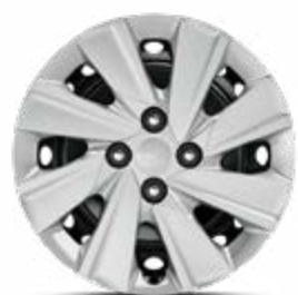
15" stalen velg S