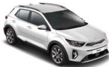
Snow White Pearl _ SWP