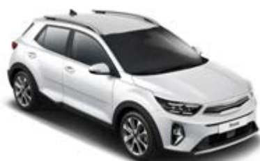
Clear White _ UD