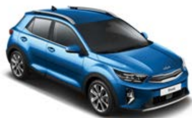
Sporty Blue _ SBP