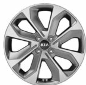
17" lichtmetalen velg M (enkel als accessoire verkrijgbaar)