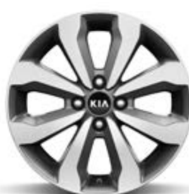
16" lichtmetalen velg M