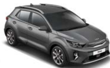
Astro Grey _ M7G