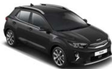
Aurora Black Pearl _ ABP