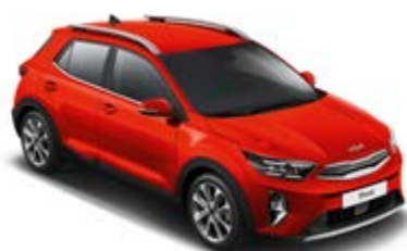
Signal Red _ BEG