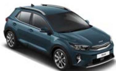
Smoke Blue _ EU3