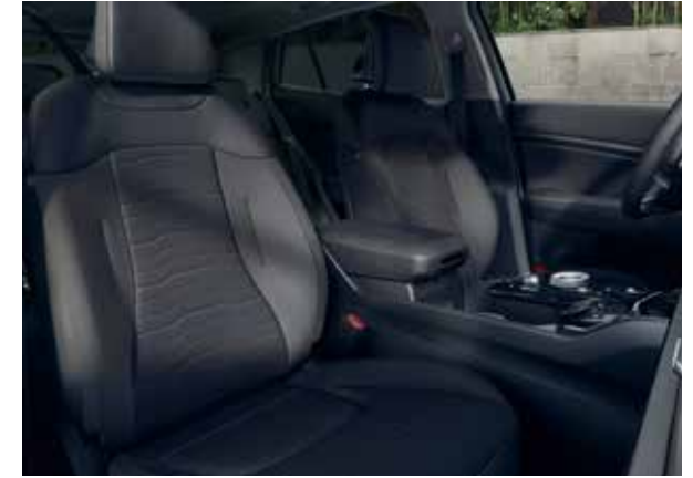
Sportage DynamicPlusLine: zwart stof/kunstleder.

De Sportage DynamicLine-uitvoering heeft een luxe zwarte stoffen stoelbekleding met zwarte stiksels en hemelbekleding in stijlvol grijs.