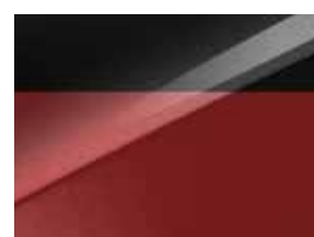
Pearl black & Infra red (HA7)