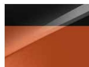
Pearl black & Orange fusion (HBB)