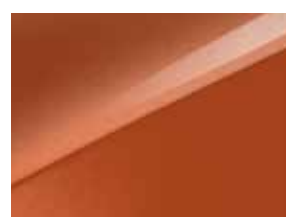
Orange fusion (RNG)