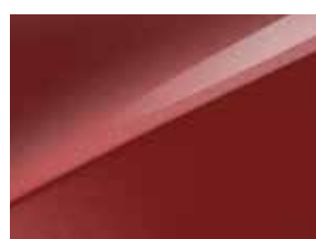
Infra red (AA9)