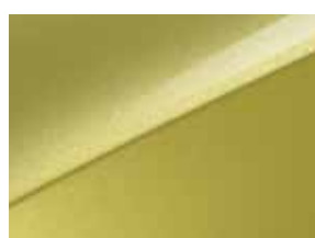
Splash lemon (G2Y)